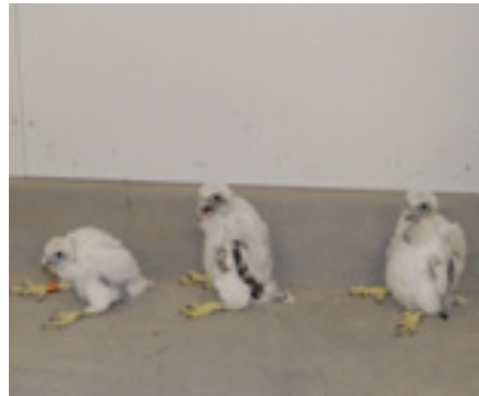
Drie jonge slechtvalken geringd in mei.